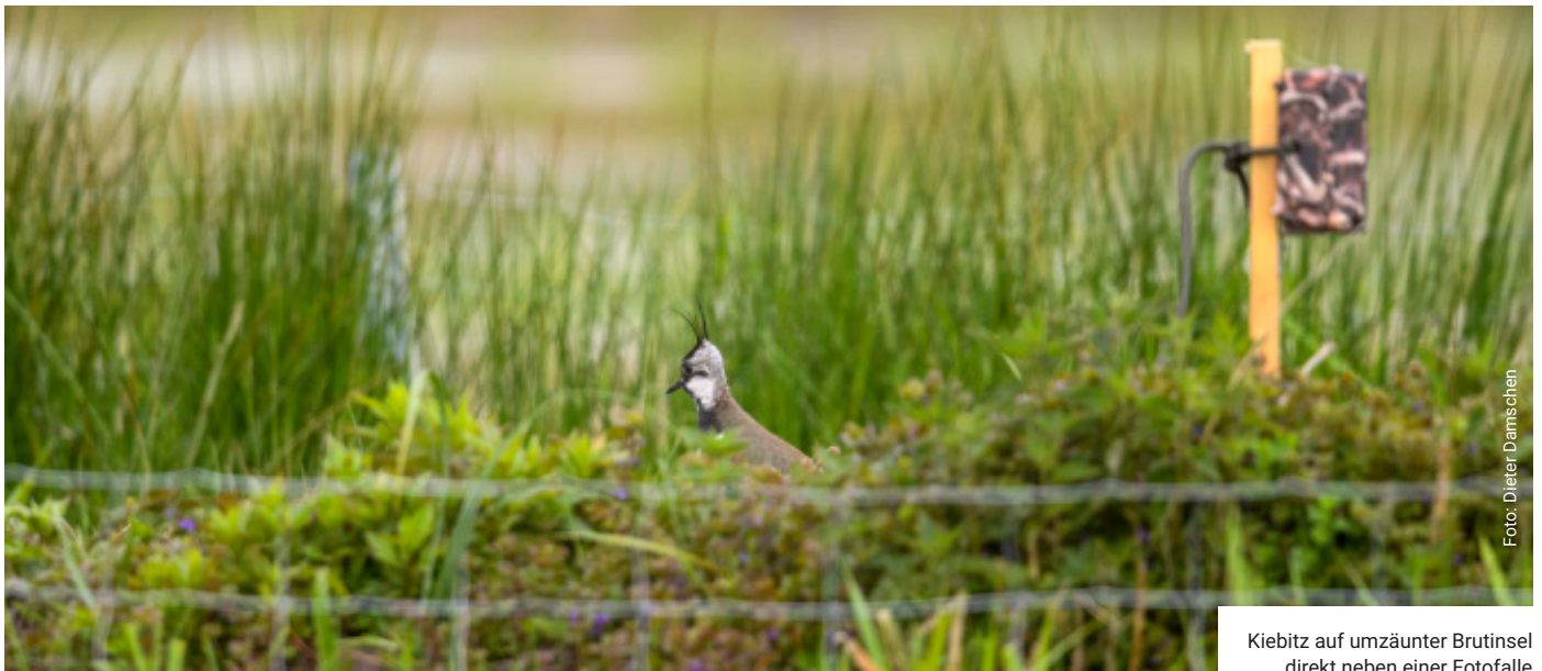
Kiebitz auf umzäunter Brutinsel direkt neben einer Fotofalle